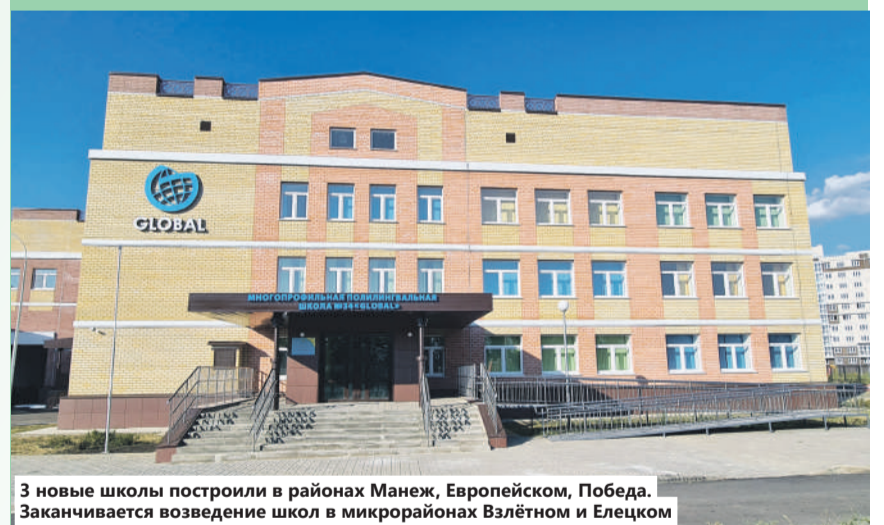
3 новые школы построили в районах Манеж, Европейском, Победа. Заканчивается возведение школ в микрорайонах Взлётном и Елецком