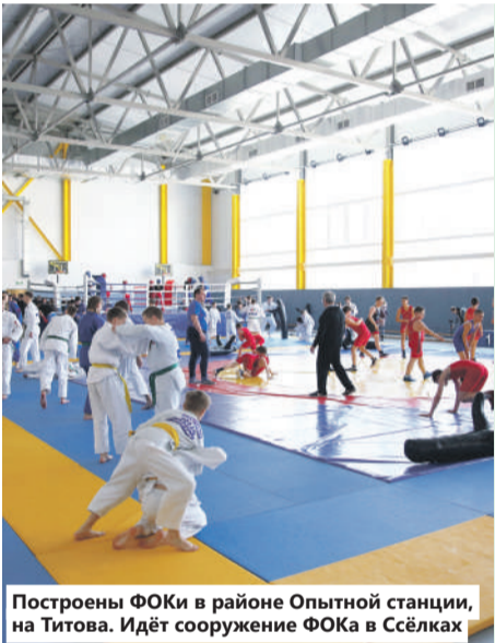
Построены ФОКи в районе Опытной станции, на Титова. Идёт сооружение ФОКа в Сёлках