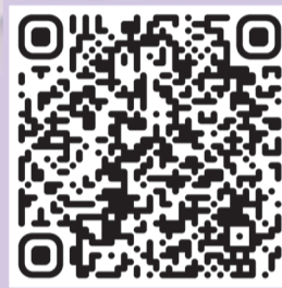
Центр молодёжной карьеры

Почти 16 тысяч жителей региона прошли профориентационные тренинги