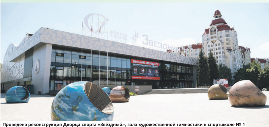
Проведена реконструкция Дворца спорта «Звёздный», зала художественной гимнастики в спортшколе № 1