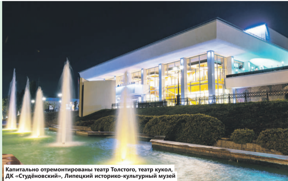
Капитально отремонтированы театр Толстого, театр кукол, ДК «Студёновский», Липецкий историко-культурный музей