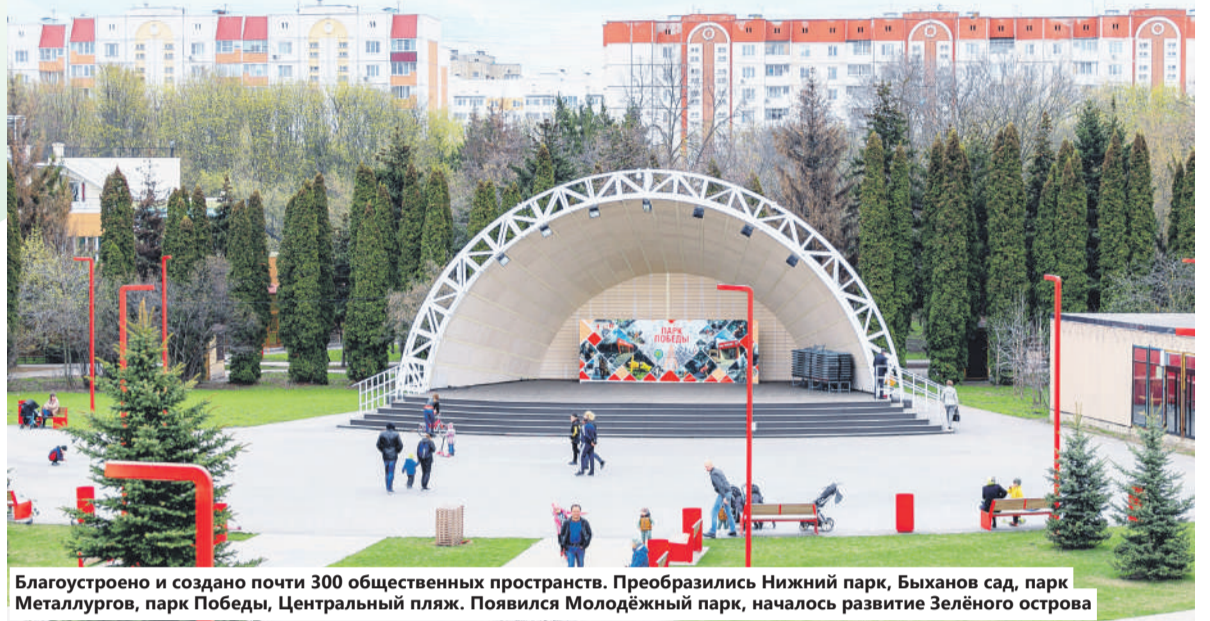
Благоустроено и создано почти 300 общественных пространств. Преобразились Нижний парк, Быханов сад, парк Metallургов, парк Победы, Центральный пляж. Появился Молодёжный парк, началось развитие Зелёного острова