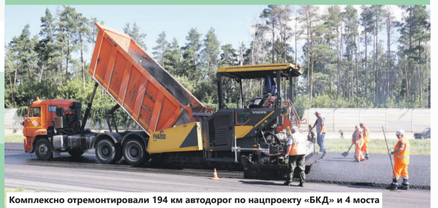
Комплексно отремонтировали 194 км автодорог по нацпроекту «БКД» и 4 моста