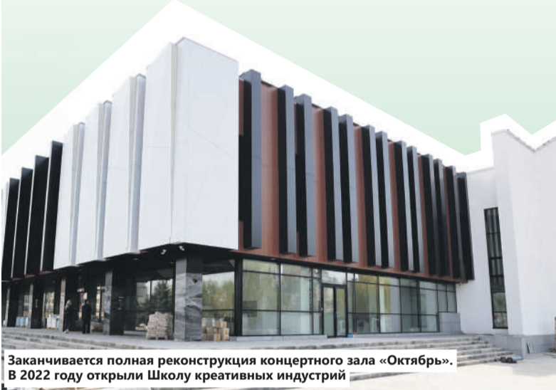
Заканчивается полная реконструкция концертного зала «Октябрь». В 2022 году открыли Школу креативных индустрий