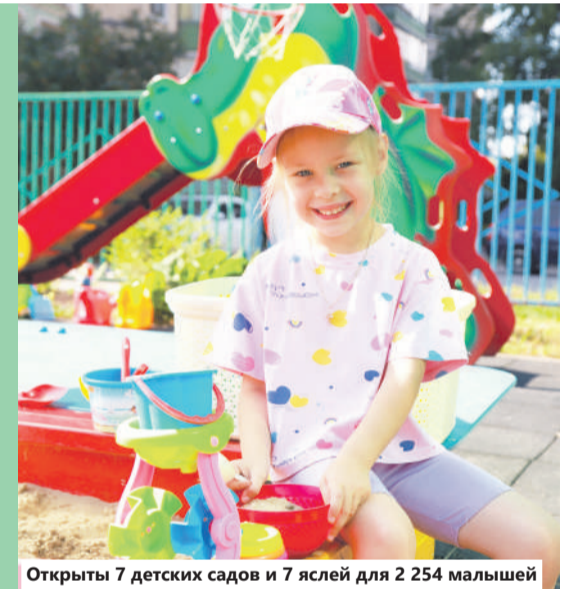
Открыты 7 детских садов и 7 яслей для 2 254 малышей