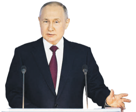
Владимир Путин, президент Российской Федерации:

Развитие малого предпринимательства и поддержка бизнес-инициатив — ещё один важный фактор развития эко-